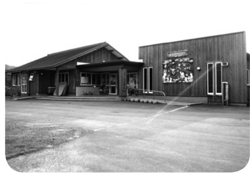
花巻市立成島保育園

成島保育園は、自然豊かな農村地域に位置していて農家の子も多いが、母親が勤めに出なければならなくなったなどライフスタイルの変化により、田んぼや畑、あるいは自然に触れる機会が、家庭では少なくなってきてしまった。そんな子どもたちが通ってきている保育園で、自然と触れ合いながら「食べることは生きること」=「食育の心」の大切さを伝えたいと考え、一連の農業体験を実施することとした。