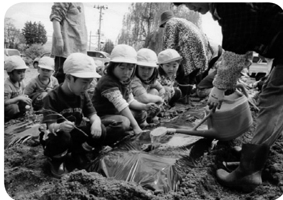
ひとつひとつの作業を真剣に見つめる