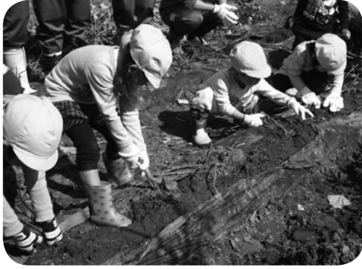
野菜づくりが子どもたちの「食べる意欲」を育てる