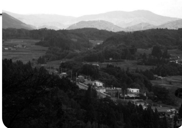
豊かな里山に囲まれた地域